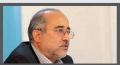
امید به تعامل سازنده بین شورای پنجم و خراسان