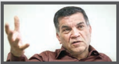
یک رسانه حرفه ای

عباس عبدی تحلیل گر و فعال اصلاح طلب: متأسفانه روزنامه خراسان جزو آن دسته از روزنامه هاست که من از مطالعه مداوم آن محروم بوده ام اما برداشتم از مطالعه گاه به گاه این روزنامه این است که روزنامه خراسان، روزنامه ای قوی است، «خراسان» هم به لحاظ نام و هم رویکرد، در میان روزنامه هایی که مرکزیت آن خارج از تهران است جزو روزنامه های نمونه محسوب می شود.