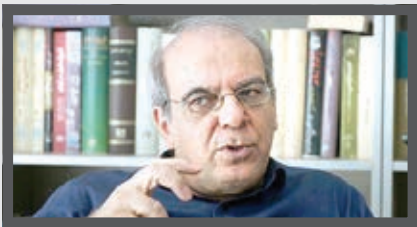
جزو روزنامه های نمونه

علیرضا رشیدیان، استاندار خراسان رضوی: قدمت و سابقه روزنامه خراسان به عنوان قدیمی ترین رسانه مکتوب در خراسان که پس از گذشت سال ها همچنان مرکز فعالیت خود را در خراسان رضوی و شهر مشهد، به عنوان کلان شهر مذهبی ایران و یکی از حوزه های موثر فرهنگی در جهان اسلام حفظ کرده است، موضوعی قابل تأمل است. روزنامه خراسان در همه سال های پس از انقلاب شکوهمند اسلامی ضمن تأثیرگذاری در حوزه فرهنگی، اقتصادی، سیاسی و اجتماعی کشور به عنوان موثرترین رسانه شرق کشور نیز شناخته شده و همیشه نگاه نادانه این رسانه مردمی در پیگیری مطالبات مردم بازند بوده است. همچنان که این رسانه در کنار پیگیری همه منافع ملی همیشه تلاش کرده است به عنوان یکی از رسانه های موثر برای حل مشکلات خراسان رضوی و شهر مشهد گام های موثری بر دارد. پیگیری مداوم در قالب گزارش های متعدد و مطالبه گرانه برای تخصیص بودجه های استان از حاشیه شهر گرفته تا یحیران آب و پروژه های عمرانی دیگر، توانسته این رسانه را به مثابه یاری در کنار مسئولان استانی قرار دهد. تلاش برای بی طرفی و برهیز از جناح بازی در موضع گیری های سیاسی و حفظ جایگاه مستقل خود در حوزه رسانه ای، منعکس کردن حرف مردم بدون ملاحظاتی و پیگیری های مجدانه این خواسته ها از مسئولان استانی، توجه به نسل نوجوان و جوان باتدین و چاپ ویژه نامه های «جیم» و «بایت»، توجه به موضوع خانواده و زنان با چاپ ویژه نامه «زندگی سلام» و نیز حضور تأثیرگذار در فضای مجازی با نرم افزار «آخرین خبر» و کانال های تلگرامی «آخرین خبر» و «اخبار خراسان» از دیگر اقداماتی است که نشان می دهد این رسانه خواسته و توانسته در مسیر انجام رسالت خود به درستی عمل کند.