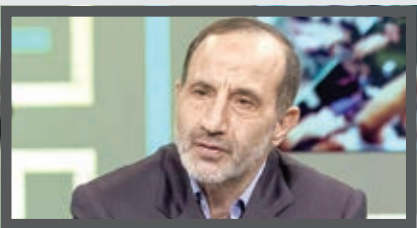
اعتدال سیاسی و دوری از حاشیه، ویژگی خراسان است