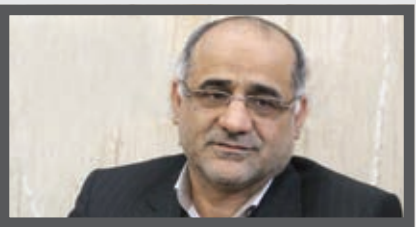
خراسان رسانه ای مردمی است

آن بودیم که واقعا در جایگاه هایی که لازم بوده از منافع شهر دفاع وسیعی کردند گزارش های سیاسی خود را در این موارد دخالت ندهند و بر همین اساس است که مادر شورای پنجم امید داریم، روزنامه خراسان به کمک ما و مدیریت شهری بیاید، تا ما بتوانیم در یک تعامل سازنده، به شهر مشهد خدمت کنیم.