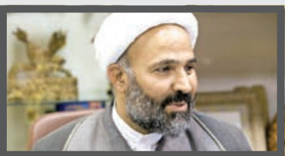
«خراسان» برندی ملی است

دکتر حسن قاضی زاده هاشمی، وزیر بهداشت، درمان و آموزش پزشکی: روزنامه خراسان را زمانی که نوجوان و جوان بودم، بسیار می خواندم و به نظر من روزنامه خیلی خوبی بود و طرفداران زیادی داشت. اکنون نیز اگر چه مانند آن دوران فرصت مطالعه این روزنامه را ندارم اما اخبار و مطالب آن را دورادور دنبال می کنم و اطمینان دارم که هنوز هم این روزنامه طرفداران زیادی دارد. امیدوارم روزنامه خراسان همواره در امر خبررسانی، همه جوانبی را که رعایت آن از سوی یک رسانه مردمی لازم و ضروری است، مدنظر داشته باشد.