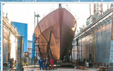
پروژه احیای ناوشکن دماوند

سهند بازتاب راداری کوچک‌تری دارد و نسبت به جماران، سخت‌تر قابل شناسایی است.