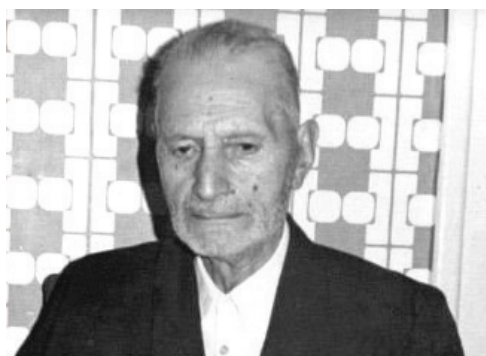
استاد محمدتقی شریعتی

روزنامه خراسان، قدیمی‌ترین روزنامه محلی همچنان فعال در ایران است؛ آن هم در منطقه‌ای که باید آن را در زمره نواحی پر ظرفیت برای پرورش شخصیت‌های علمی، ادبی و سیاسی دانست. بدیهی است که در چنین شرایطی، می‌توان رد پای بسیاری از بزرگان را در روزنامه خراسان یافت؛ بزرگانی که هر چند بیشترشان به رحمت خدا رفته‌اند اما نام‌وزین آن‌ها در تاریخ روزنامه خراسان به یادگار مانده‌است. از میان این جمع پر شمار، به تعدادی اندک برای معرفی به شما خوبان بسنده کرده‌ایم.