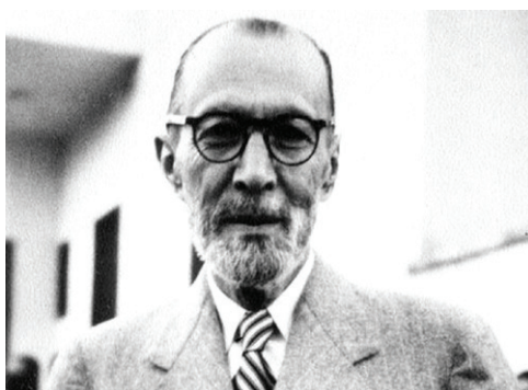
ملک الشعرا ی بهار

متولد سال ۱۲۸۶ ش در مزینان، الهی‌دان، مفسر قرآن و نویسنده برجسته معاصر. استاد شریعتی به صورت بسیار محدود و پراکنده، مقالاتی را در روزنامه خراسان، تا قبل از کودتای ۲۸ مرداد ۱۳۳۲ منتشر کرد؛ نوشته‌هایی که عموماً فاقد نام بودند. شریعتی به عنوان یکی از شخصیت‌های برجسته دینی و سیاسی مشهد، بعد از پیروزی انقلاب نیز، مطالبی را در روزنامه خراسان منتشر می‌کرد. این مطالب، عموماً در قالب نقدهای سیاسی، مقالات معرفتی و اطلاعاتی‌های فرهنگی و اجتماعی بود. آن مرحوم که به «سقراط خراسان» نیز شهرت داشت در ۳۱ فروردین سال ۱۳۶۶، در ۸۰ سالگی، دارفانی را وداع گفت و در حرم رضوی به خاک سپرده شد.