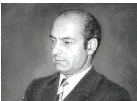
دکتر علی شریعتی

متولد ۱۹ مهر سال ۱۳۱۸ در کدکن؛ استاد نامدار ادبیات فارسی و شاعر برجسته دوران معاصر. وی نخستین بار در دهه ۱۳۳۰ با نگارش مقالات ادبی، به فعالیت در روزنامه خراسان پرداخت. استاد شفیعی کدکنی، مقالات خود را با نام مستعار م. سرشک که تخلص شعری وی بود، در روزنامه چاپ می‌کرد. افزون بر مقالاتی که برخی از آن‌ها مرتبط با مسائل روز فضای ادبی جامعه بود، وی برخی از اشعار خود را هم در روزنامه خراسان منتشر کرده‌است. ظاهراً همکاری وی با روزنامه، تا زمان اتمام دوره لیسانس در دانشگاه مشهد ادامه داشته است. استاد شفیعی کدکنی افزون بر دانشگاه، در درس‌های بزرگان حوزه، مانند ادیب نیشابوری نیز شرکت می‌کرد و با محافل ادبی خراسان، ارتباطات گسترده‌ای داشت.