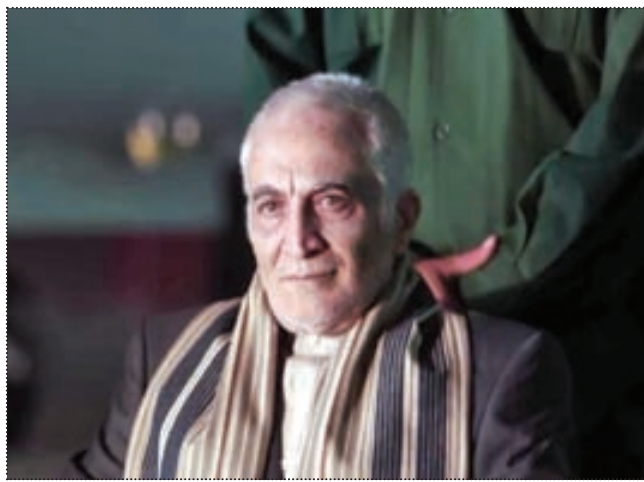
«حکم» شخصیتی که در سریال حیوانات سیاسی از آن به عنوان رئیس جمهور ایران یاد کردند.