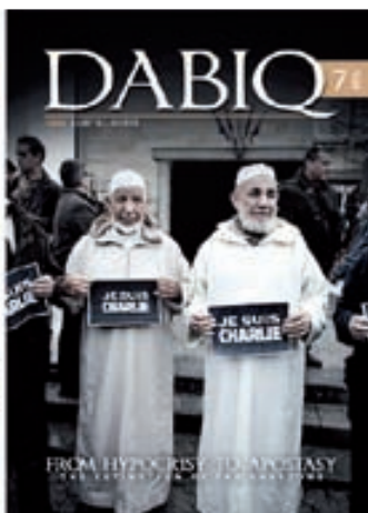
دابق، نشریه ای انگلیسی زبان معرفی و تبلیغ تفکر گروه تروریستی داعش است