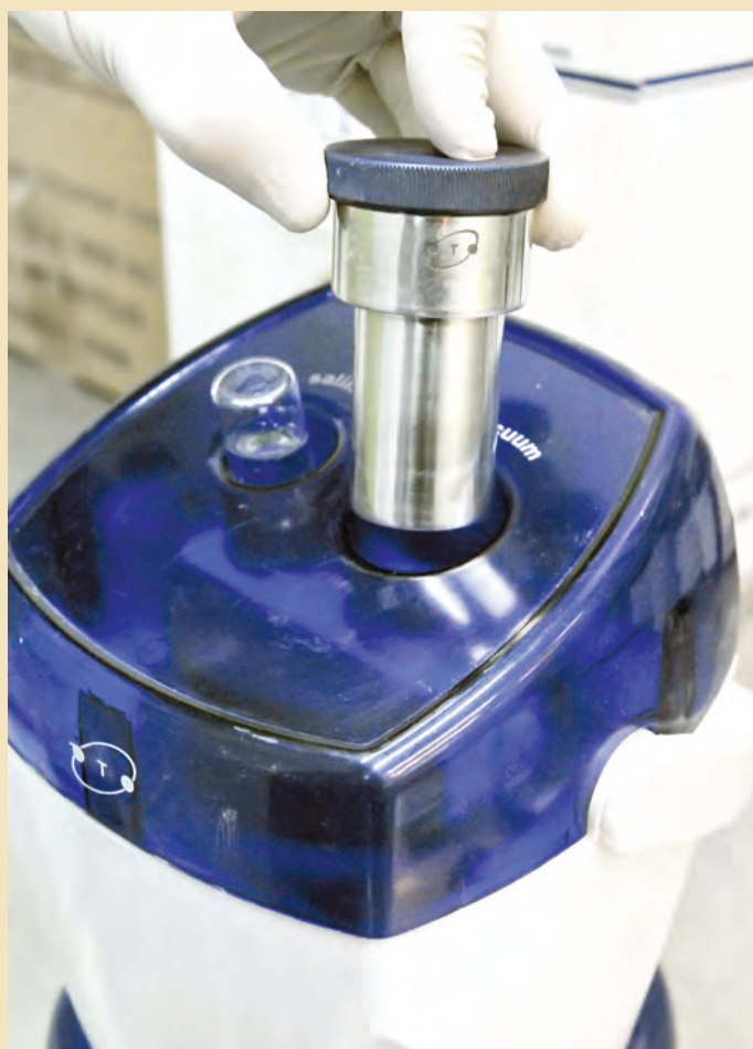
❖ ژنراتورهای حاوی رادیو دارو داخل ظروف پلاستیکی و آماده برای ارسال به مراکز پزشکی هسته‌ای