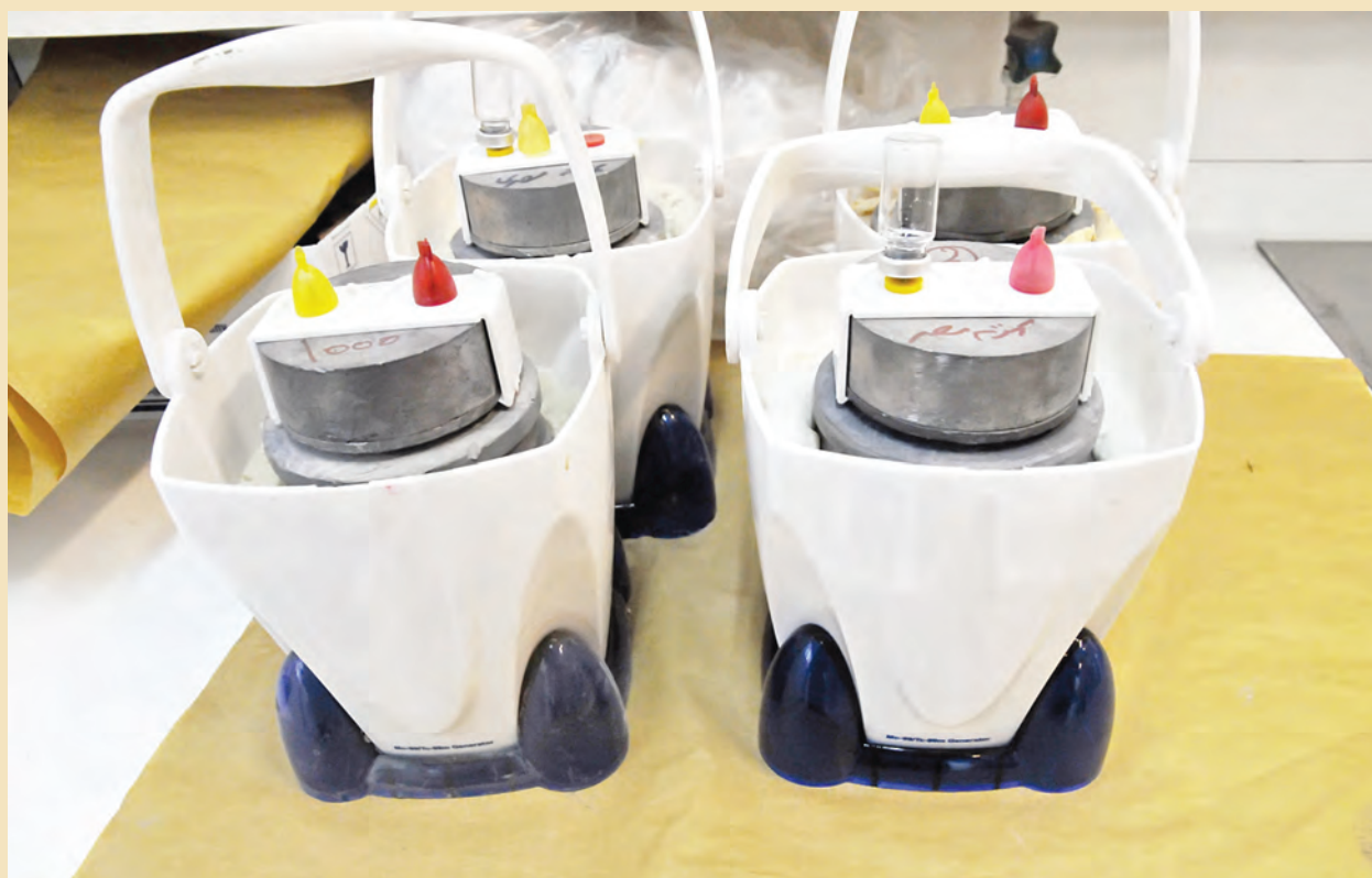
❖ ژنراتورهای حاوی رادیو دارو داخل ظروف پلاستیکی و آماده برای ارسال به مراکز پزشکی هسته‌ای